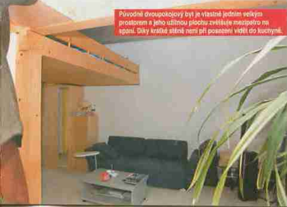
Původně dvoupokojový byt je vlastně jedním velkým prostorem a jeho užitnou plochu zvedá mezipatro na spaní. Díky krátké stěně není při posazení vidět do kuchyně.