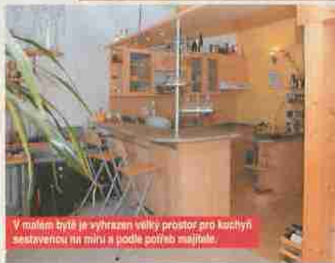
V malém bytě je vyhrazen velký prostor pro kuchyni sestavenou na míru a podle potřeb majitele.

Přenosná pekárna není o moc větší než mikrovlnka. V kuchyni s množstvím kořenek v po-