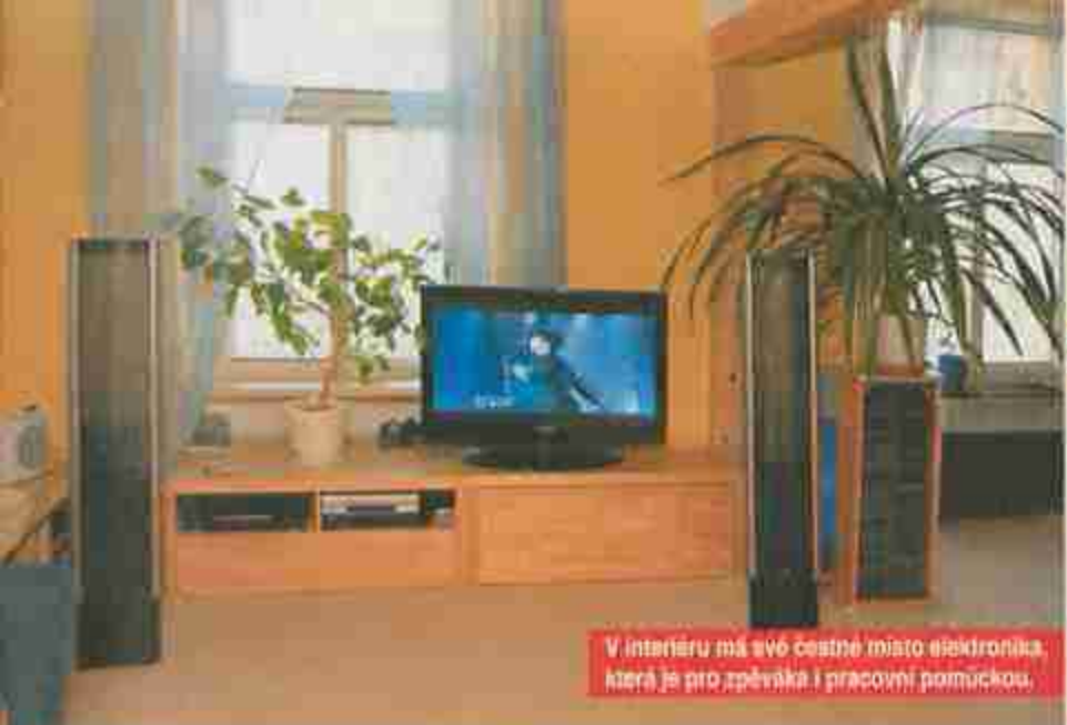
V interiéru má své bohaté místo elektronika, která je pro zpěváka i pracovní pomůckou.